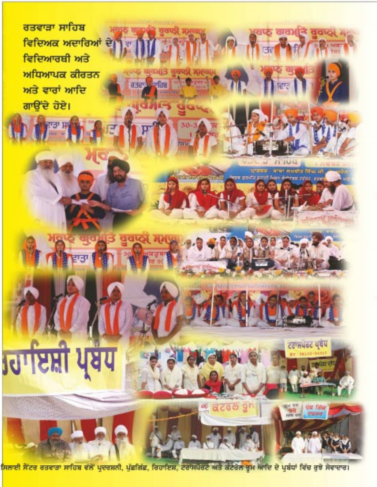
ਸਿਲਾਈ ਸੈਂਟਰ ਰਤਵਾੜਾ ਸਾਹਿਬ ਵੱਲੋਂ ਪੁਦਰਸ਼ਨੀ, ਪੁੱਛਗਿੱਛ, ਰਿਹਾਇਸ਼, ਟਰਾਂਸਪੋਰਟ ਅਤੇ ਕਟਰੋਲ ਰੂਮ ਆਦਿ ਦੇ ਪ੍ਰਬੰਧਾਂ ਵਿੱਚ ਰੁਝੇ ਸੇਵਾਦਾਰ।

ਰਤਵਾੜਾ ਸਾਹਿਬ ਵਿਦਿਅਕ ਅਦਾਰਿਆਂ ਦੇ ਵਿਦਿਆਰਥੀ ਅਤੇ ਅਧਿਆਪਕ ਕੀਰਤਨ ਅਤੇ ਵਾਰਾਂ ਆਦਿ ਗਾਉਂਦੇ ਹੋਏ।